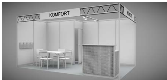
Material : Octanorm, mattsilber Euro 77,- pro Quadratmeter

Teppichboden gesamte Standfläche Rück- und Seitenwände Ab 12 qm Kabine 2 m x 1 m mit Tür abschließbar Duoträger, umlaufend Blendenschilder 2 m x 0,3 m Beleuchtung pro 3 qm 1 Strahler