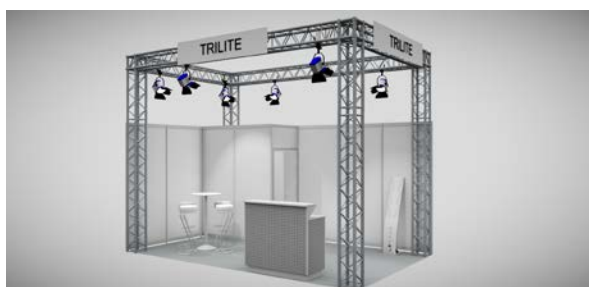
Material : 4-Punkt Traversen Euro 135,- pro Quadratmeter

Teppichboden gesamte Standfläche Rück- und Seitenwände Ab 12 qm Kabine 2 m x 1 m mit Tür abschließbar Metroline-Träger, umlaufend Blendenschilder 2 m x 0,3 m Beleuchtung Spots, Gehäuse metallic, 150 Watt 1 Prospektständer „Simona“, 1 Stehtisch 4 Barhocker, , 1 Theke mit Baraufsatz 1 Barhocker dazu