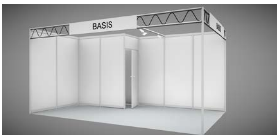
Material : Octanorm, mattsilber Euro 55,- pro Quadratmeter